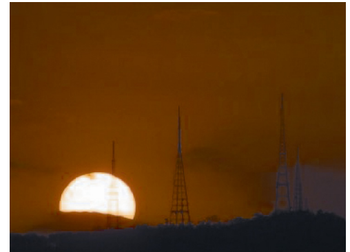
Weitverkehrsnetze – koordiniert durch O&M-Software von Mixed Mode

Mit dediziertem Know-how aus der Telekommunikation liefert Mixed Mode die ideale Ergänzung zu den Kernkompetenzen des Kunden. Neben Software werden auch Hardware-Module für Prototypen realisiert.