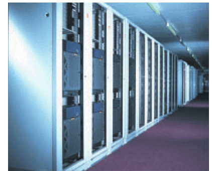
Durch Mixed Mode Software überwachtes Netz