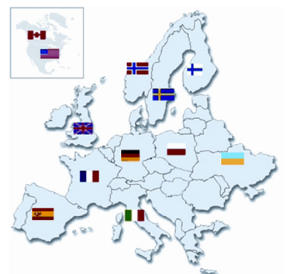
Netzwerkkoordination für ganz Europa